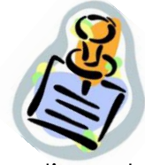
Tableau de consignation